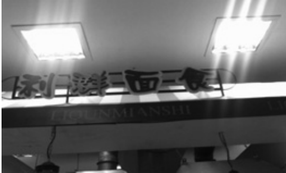
写真12 スーパー内のテナント店