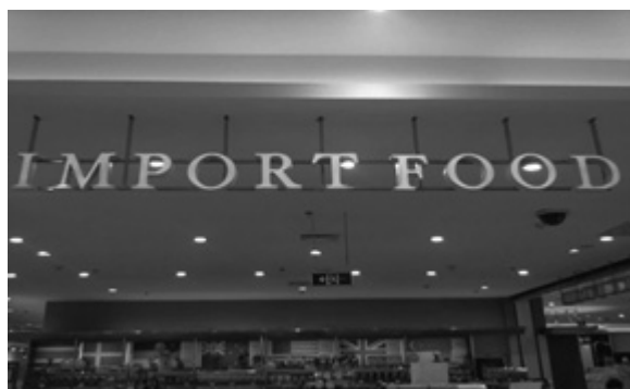
写真5 商品陳列コーナー