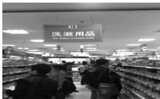
写真10 商品陳列コーナー