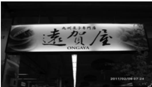
写真13 スーパー内のレストランの看板