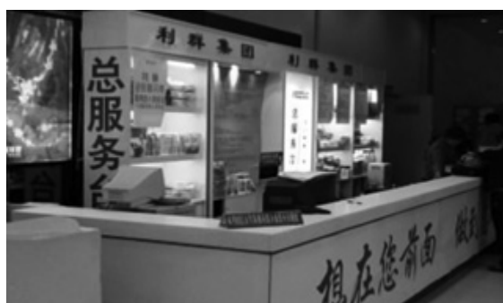
写真11 サービスコーナー