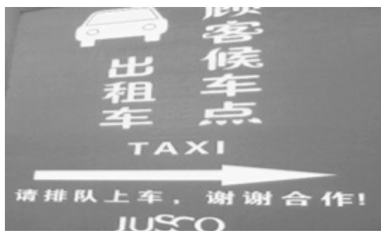
写真4 タクシー乗り場