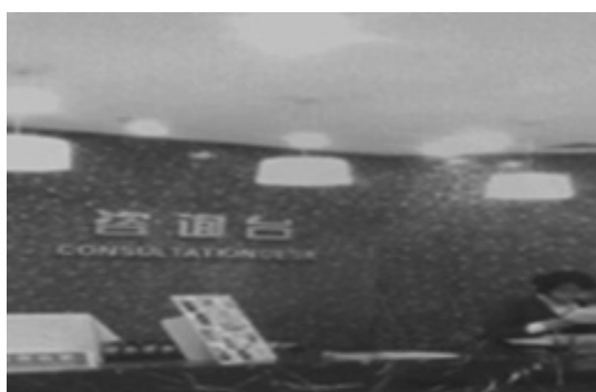
写真8 総合サービスカウンター