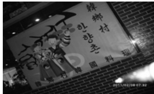
写真14 テナント店の看板