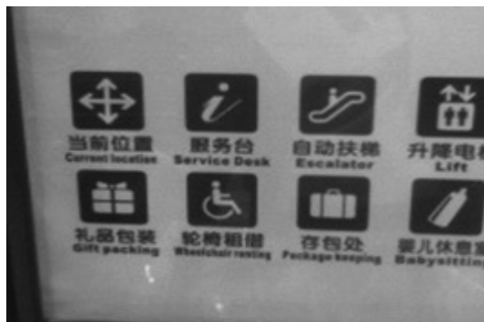
写真6 ピクトグラムの表示