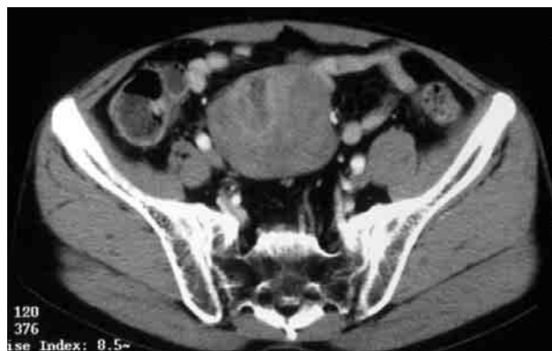
図1 腹部造影CT所見：内部が不均一にEnhanceされる充実性腫瘍を認めた。