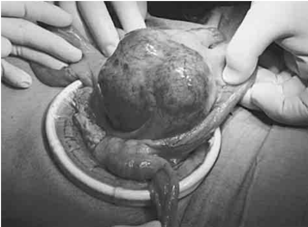
図2 術中所見：回腸末端より15cmの回腸間膜由来の腫瘍を認めた。周囲との癒着や浸潤傾向はなかった。

デスマイド腫瘍は線維腫症の一種で Stout ら 1) の定義によると分化した線維芽細胞の増殖、浸潤性発殖した細胞間に線維芽細胞が存在し、核異型を認めず、遠隔転移はないが局所再発を繰り返すとされている。発生部位により腹壁デスマイド、腹壁外デスマイド、腹腔内デスマイドに分類され 2) 、Reitamo ら 3) によれば腹腔内デスマ