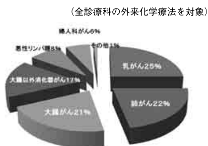
図1 がん化学療法部門概要 (外来化学療法室)

大腸癌以外の消化器癌: 胃癌, 食道癌, 肝臓癌, 胆道癌, 膵臓癌, その他の癌: 頭頸部癌, 脳腫瘍, 膀胱癌, 急性リンパ性白血病