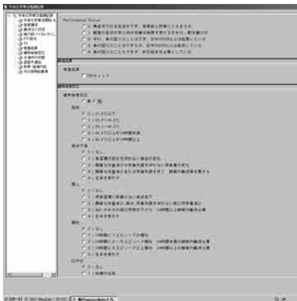
図4 外来化学療法看護記録

ance Status, ⑨検査データ, ⑩副作用評価, ⑪過敏反応, 血管外漏出などのモニタリング, ⑫患者教育・指導内容等が電子カルテに入力され, 多職種間の情報共有につながっている 2) (図4)。