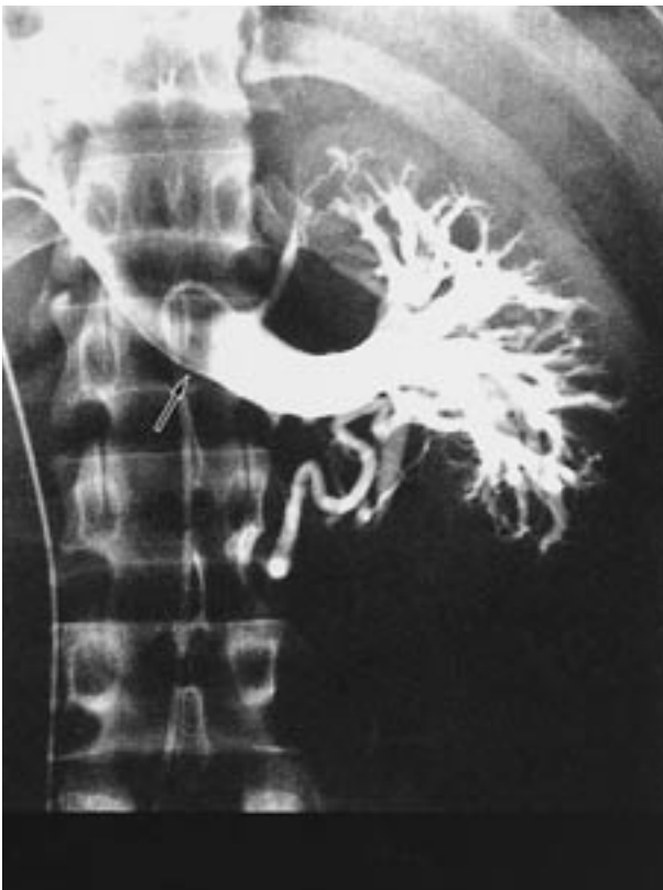
図3 左腎静脈造影: 左腎静脈には上腸間膜動脈の圧痕が見られる( )。腎静脈本幹から下大静脈への還流不良を認め, 腎門部からの側副血行路を見る。

次に, 無症候性血尿の原因疾患を考える時, どのような注意点があるのか諸家の報告を参考に述べてみる。経験的に, 肉眼的血尿が顕微鏡的血尿に比し悪性腫瘍を始