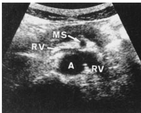
図2 超音波検査：左腎静脈（RV）は腹部大動脈（A）と上腸間膜動脈（MS）の間で著名に左迫されている。