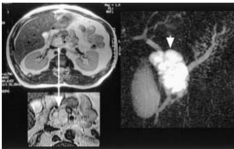
図2 腹部MRI検査, MRCP T2強調画像で内部に隔壁を有するhigh intensity mass認め、MRCPではブドウの房状の多房性嚢胞性病変を認めた(↓)。