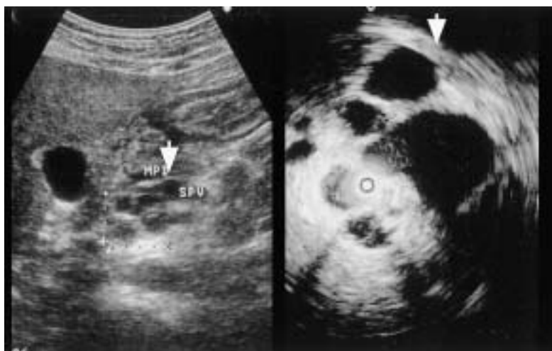
図1 AUS, IDUS (膵管内超音波検査) 膵頭部に隔壁構造を有する4 cm大の多房性嚢胞性病変を認めた(↓)。

手術所見：膵頭部背側に弾性軟な4 cm大の多房性嚢胞性病変を認めた。悪性是否定的であり、縮小手術にとどめる方針とし、胆道、十二指腸温存膵頭部切除術を行った。切除終了時点で総胆管下部、十二指腸乳頭部の血流が悪く、術後狭窄、穿孔をきたす恐れがあったため、下部胆管、十二指腸第Ⅱ部切除術を追加した(図4a)。再建はRoux-en-Y法で空腸を挙上し、膵管空腸粘膜吻合、胆管空腸吻合を行い、十二指腸端々吻合を行った(図4b)。