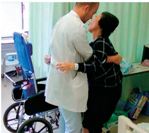
図2 術前 自立歩行不能で車椅子や介助が必要な状態

全例、手術前後でBFMDRSの改善を認めた。Sobstylらの研究 (Neurol Neurochir Pol. 2016) で遅発性ジストニアに対するDBS施行例 (淡蒼球内節55例, 視床下核4例) において手術前と手術後でBFMDRSの80%以上の改善があったと報告があるが, 今回の研究結果はその結果と矛盾せず, 徳島大学病院においても有効性が示された。遅発性ジストニアは抗精神病薬の服用者に散見され, 重症例は薬物療法のみでは対応困難な場合がある。そのため遅発性ジストニアに対して, GPi-DBSは有効性の確立された副作用も少ない治療法であると啓蒙が必要である。