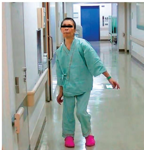
図3 術後 自立歩行可能になった