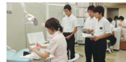
←歯科衛生士の説明を聞く中高生

平成22年8月17日、医療現場で活躍する医療技術職員の仕事を知ってもらうことを目的とした、「徳島大学病院医療技術職員職場体験」を本院診療支援部が主催となり開催しました。中高生を中心とした参加者41名は各部門を回り、臨床検査技師や診療放射線技師などの医療技術職員の仕事を学びました。参加者は、顕微鏡で血液細胞を観察したり、マネキンの歯の表面を機械で磨いたり、コンピューター断層撮影装置(CT)でスイカの断面図を撮影したりするなど、どの体験にも真剣に取り組み、充実した職場体験となりました。