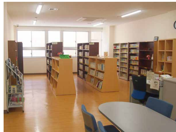
1階の患者図書室の様子。

病院の敷地を一体化し、駐車場の共同利用も予定しております。この工事が完成すれば、外来診療棟玄関での車の乗降スペースが広がり、障がい者用駐車スペースも増える予定です。工事の騒音等で引き続きご迷惑をおかけしますが、ご理解、ご協力を賜りますようお願い申し上げます。