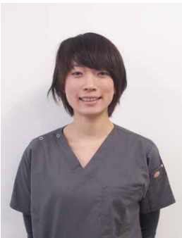
臨床検査技師 (超音波検査士) 診療支援部臨床検査 技術部門