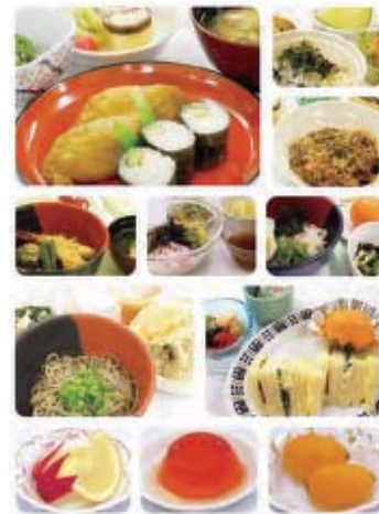
化学療法中の患者さんの食欲増進を目的として導入した患者食。