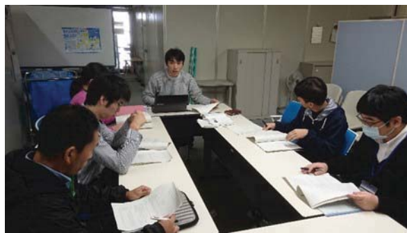
図 1 集合研修

受講者はテキストに従い課題を研修期間終了までに実施した。課題は実施担当者が作成したサンプルプログラム (図 2) の改良またはオリジナルゲームの作成を受講者各自の都合等により調整して実施するようにした。