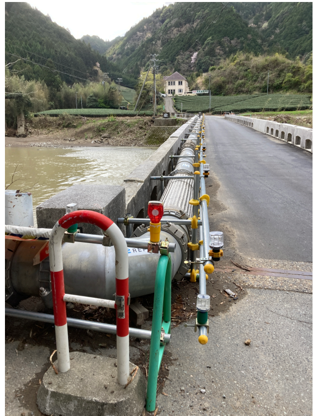
写真-1 復旧後の宮嶋橋水管橋

給水車は透析医療機関だけではなく他の施設や給水拠点も担当しているケースがあり、定期的かつ安定した応