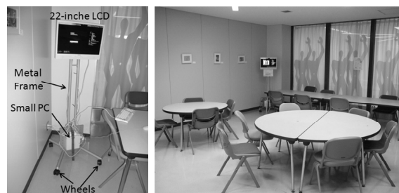
Fig. 3 Niche-Learning system on public space in university building

コンテンツを作成する学生コンテンツクリエイター (以下, 学生 CC と記す) を募集し, 3 名の学生 (メディアアートに興味を持つ学部生) を u ラーニングセンターの予算でアルバイトとして採用した.