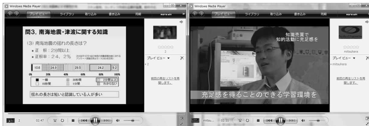
(a) Quiz slideshow (video) about disaster prevention

これまでの運用を振り返ると、プロジェクト専属メンバーではない教職員2名がプロジェクトを円滑に運用するのは難しいと言える。例えば、2008年1月に試作システムが完成して同年4月に配信を開始する間、教員は学生指導や学会参加で多忙となり、プロジェクトに十分な時間を割けなかった。Niche-Learning プロジェクトは決