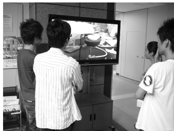
Fig. 4 Niche-Learning system on central entrance in university building