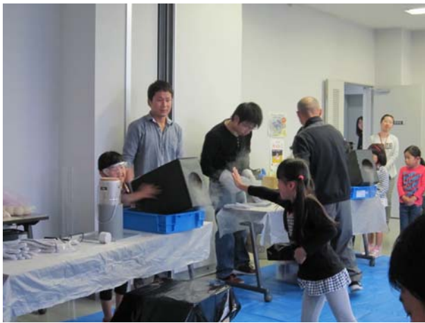
図2 空気砲の体験の様子

その後の体験では、子供達は空気砲からの白い渦輪の様子や冷たい感触に喜んでおり、非常に好評であった(図2)。