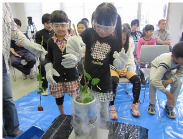
図1 バラを用いた実験の様子