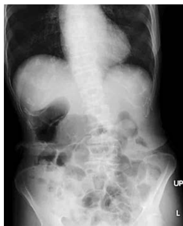
図1 来院時腹部単純X線写真 大腸のガスと糞便像を認めた。小腸ガスも認めたが、niveauや小腸の拡張は認めなかった。