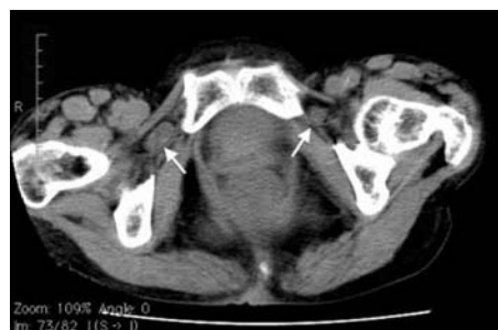
図4 入院1週間後骨盤CT 1週間後の骨盤CTでは自然整復していた右側に再度膀胱の嵌入を認め、両側嵌入となっていた(矢印)。